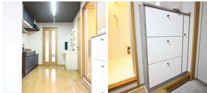
※図面と現状が異なる場合は、現状を優先とします。