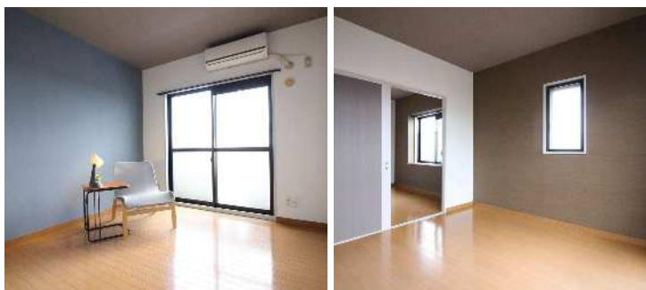
※図面と現状が異なる場合は、現状を優先とします。