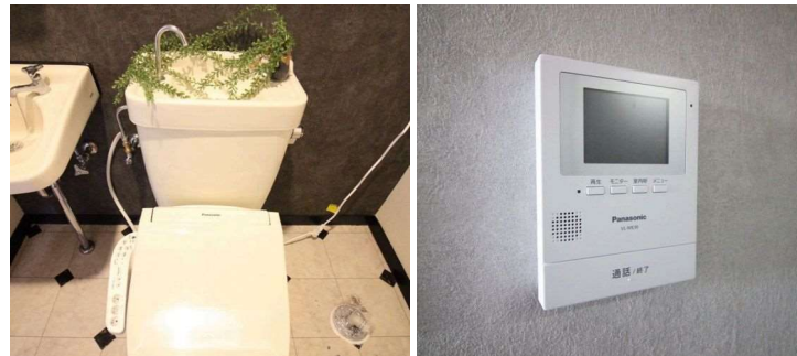
※図面と現状が異なる場合は、現状を優先とします。