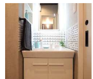
※図面と現状が異なる場合は、現状を優先とします。